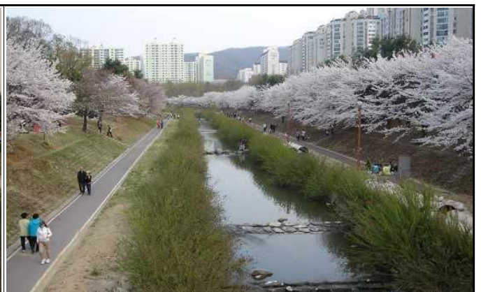
사업 완료 후